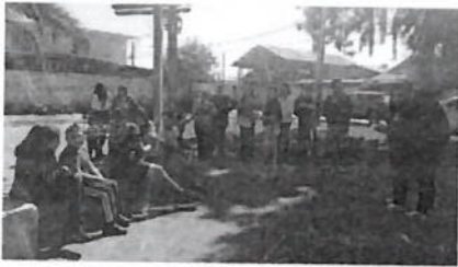
Figura 4: Primera pausa reflexiva del recorrido barrial, realizada en la plaza de la Villa Esperanza III.