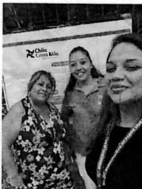
Figura 3: Se realizó difusión en el territorio, en compañía de la dirigente de Villa Esperanza III, facilitando el vínculo con la comunidad.