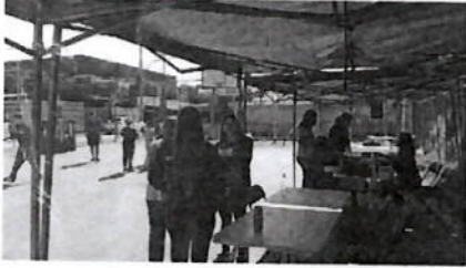
Figura 3: Últimos preparativos en la cancha de la Villa Esperanza III, previos a la ejecución de la actividad.