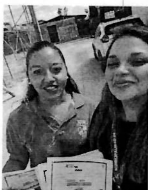
Figura 2: Se llevó a cabo difusión en Villa Esperanza III el día viernes 20 de marzo, en el marco de las actividades programadas.