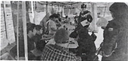
Figura 6: Tercera pausa reflexiva realizada en la cancha ubicada en el pasaje Ernesto Valdés, donde se desarrolló la actividad de cierre.