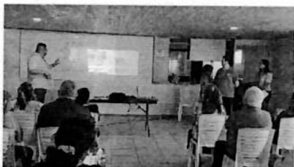
Figura 1: Reunión informativa dirigida a vecinos y vecinas de la Villa Esperanza III, en el marco de los programas Transformando Barrios con NNA y Crecer en Comunidad.