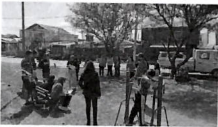
Figura 5: Segunda pausa reflexiva realizada en la plaza ubicada en calle Desiderio Molla.